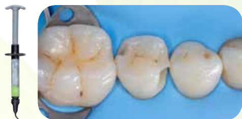
Nekariozinių pažeidimų gydymas