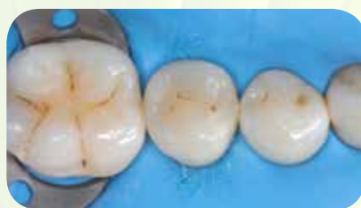
Restauravimas su Essentia LoFlo Universal