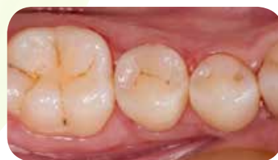
Pooperacinis vaizdas po poliravimo