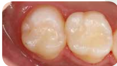
Pooperacinis vaizdas, kuriame stebimas puikus medžiagos susiliejimas su natūraliais dantimis