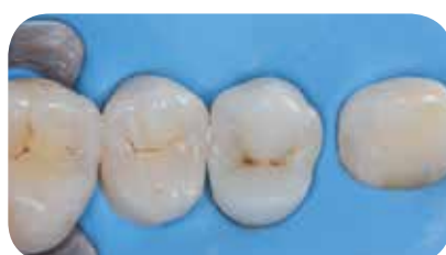
Dentino pagrindas atkurtas naudojant everX Posterior medžiagą, paviršinis sluoksnis- Essentia Universal