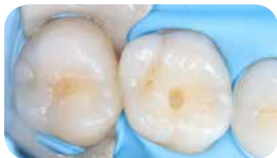
Mažos I klasės ertmės paruošimas