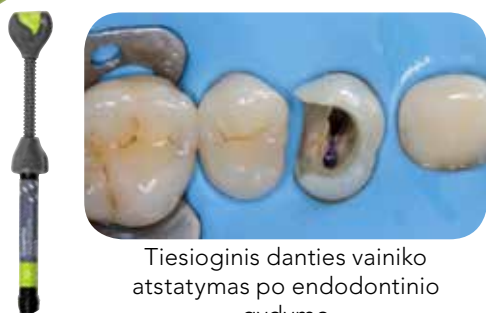
Tiesioginis danties vainiko atstatymas po endodontinio gydymo