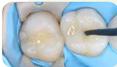
Restauravimas naudojant Essentia HiFlo Universal