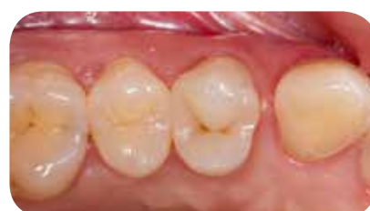
Apžiūros metu, po 6 mėnesių pasitvirtino gera restauracijos integracija su šalia esamais danties audiniais