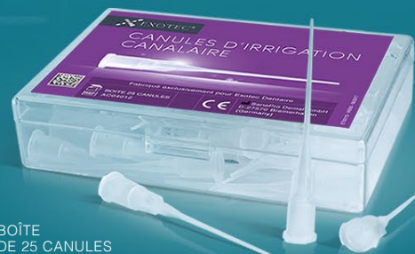
BOÎTE DE 25 CANULES